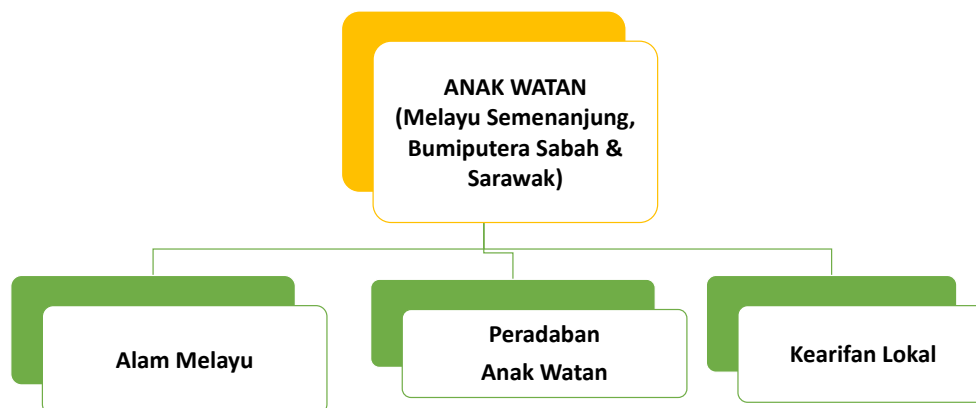
Rajah 1: Konsep Pelantar Anak Watan (PAW)

Pelantar Anak Watan merupakan suatu konsep baharu diperkenalkan oleh penulis untuk melihat titik persamaan antara orang Melayu Semenanjung Malaysia dengan bumiputera Sabah dan Sarawak. Hal ini penting dengan matlamat untuk merungkai jurang perbezaan antara mereka sama ada dari segi politik, ekonomi mahupun sosial (Othman, Yusoff, Jupiter & Mokhtar, 2021c). Mereka sebagai anak watan memiliki sejarah peradaban yang sama yang seharusnya menjadi payung kepada pembinaan negara bangsa. Usaha ini juga perlu bagi memupuk integrasi, sungguhpun mereka dipisahkan dari segi geo fizikal dan wilayah, yakni Laut China Selatan. Elemen konsep Pelantar Anak Watan boleh dilihat dari segi tiga dimensi iaitu Alam Melayu, peradaban anak watan dan kearifan lokal.